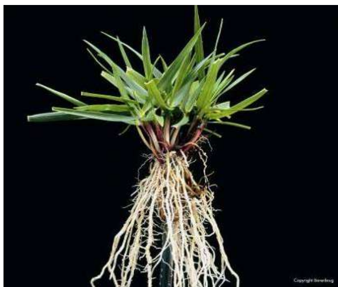
Abb.3: Rohrschwengel mit beeindruckender Wurzel